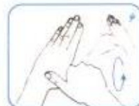
هست دست چپ را به صورت چرخشی توسط کف دست راست بمالید. این عمل را با دست دیگر نیز انجام شود.