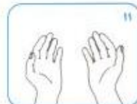
حال دست‌های شما تمیز هستند.