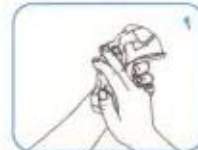
دست‌ها را با حوله (دستمال) یکبار مصروف خشک کنید.