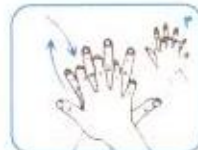
کف دست راست را به پشت دست چپ و نای انگشتان بمالید. این عمل با دست دیگر نیز انجام شود.