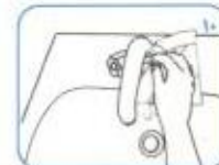
از همان حوله برای پستن آب استفاده کنید.