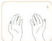
صبر کنید دست‌ها خشک شوند. حال دست‌های شما تمیز هستند.