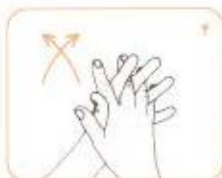
کف دست‌ها و بین انگشتان را به هم بمالید.