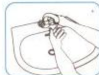
دست‌ها را با آب خیس کنید.