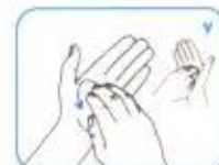
کف دست چپ را به صورت چرخشی با انگشتان خم شده دست راست بمالید. این عمل را با دست دیگر نیز انجام شود.