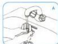
دست‌ها را آبگشایی کنید.