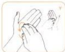
کف دست چپ را به صورت چرخشی با انگشتان خم شده دست راست بمالید. این عمل را با دست دیگر نیز انجام شود.