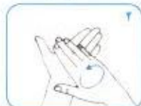
کف دست‌ها را به هم بمالید.

مدت زمان شستن دست‌ها با آب و صابون ۲۰ تا ۳۰ ثانیه است.