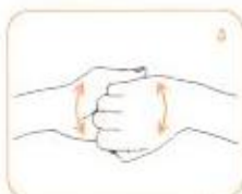
پشت انگشتان را به حالت خم شده به کف دست دیگر بمالید.