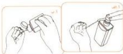
پک کف دست را از محلول کاملا پر کنید.