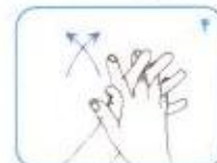
کف دست‌ها و بین انگشتان را به هم بمالید.