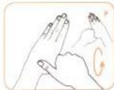
هست دست چپ را به صورت چرخشی توسط کف دست راست بمالید. این عمل را با دست دیگر نیز انجام شود.