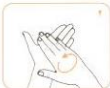
کف دست‌ها را به هم بمالید.

مدت زمان برای مالش دست‌ها ۲۰ تا ۳۰ ثانیه است.